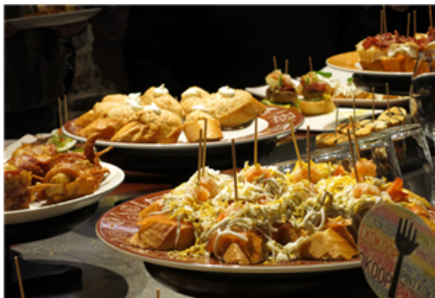
Fig. 31: Barra con pinchos en el País Vasco