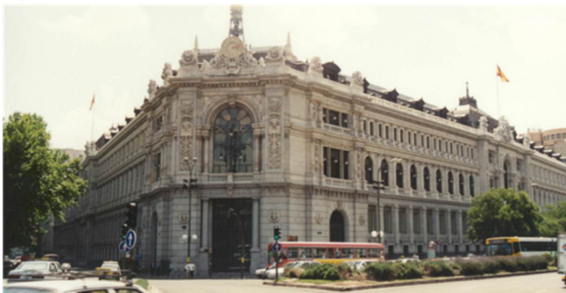
Fig. 48: Banco de España

Algunas de las instituciones económicas más importantes de España son el Banco de España, la Bolsa (el IBEX 35), el Instituto Español de Comercio Exterior (ICEX), el Consejo Económico y Social de España (CES) o la Seguridad Social de España.