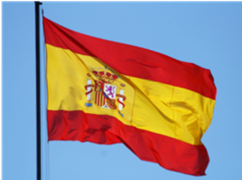
Fig. 2: Bandera de España

La bandera de España tiene tres franjas (roja, amarilla y roja): cada comunidad autónoma tiene su propia bandera y debe utilizarla junto a la española en sus edificios públicos y en sus actos oficiales.