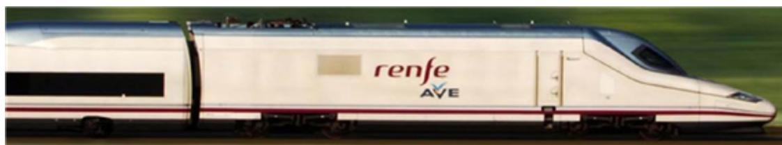
Fig. 46: AVE, tren de alta velocidad española

Puertos más importantes: Algeciras, Barcelona, Las Palmas, Bilbao, Valencia y Vigo.