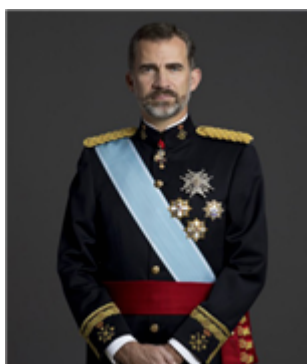
Fig. 4: Felipe VI, Rey de España

El Rey de España es el jefe del Estado y la Corona es el símbolo de la unidad de España. Tiene la máxima representación del Estado y modera el funcionamiento de las instituciones. Además, entre otras funciones, sanciona y promulga las leyes, nombra a los miembros del Gobierno, a propuesta de su presidente, y tiene el mando supremo de las Fuerzas Armadas de España.