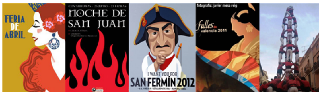
Fig. 25: carteles de fiestas tradicionales de España de repercusión internacional

Por otro lado, el toreo o corridas de toros es un espectáculo que nació en el siglo XII. Se trata de la fiesta en la que se lidian toros bravos a pie o a caballo en un lugar denominado «plaza de toros». También se practica el toreo en Portugal, en el sur de Francia y en diversos países de Hispanoamérica como Colombia, Costa Rica, Ecuador o México.