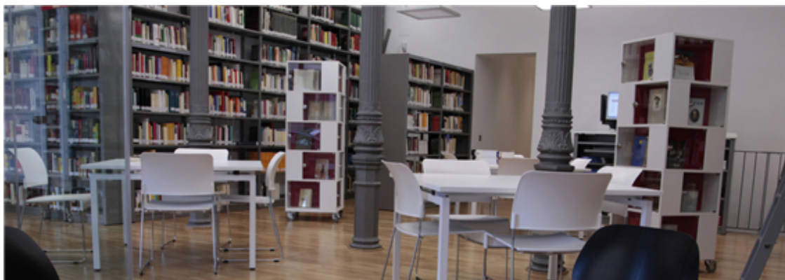
Fig. 34: Biblioteca de la sede central del Instituto Cervantes en Madrid.

los centros culturales públicos : ofrecen visitas virtuales o guiadas, talleres, etc.