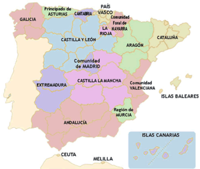
Fig. 16: Mapa político de las comunidades autónomas de España.

En el mapa político de España, se puede observar la división de España en comunidades y ciudades autónomas.