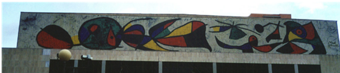
Fig. 21: Mural del Palacio de Congresos de Madrid. Joan Miró.

Barcelona; el Museo Thyssen-Bornemisza, en Madrid, y el Museo Guggenheim de Bilbao.