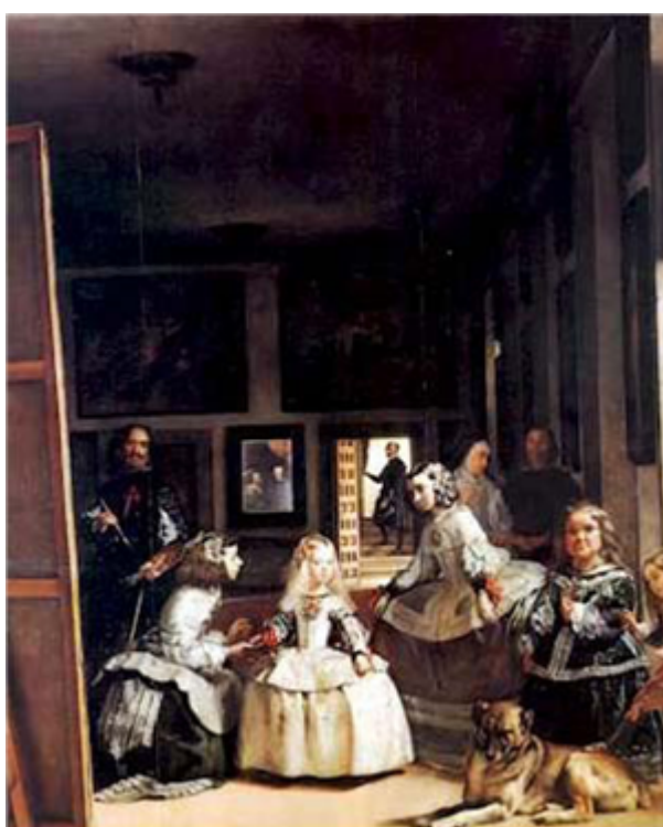
Fig. 19: Las meninas , de Velázquez.

España tiene un rico patrimonio. La UNESCO ha reconocido 47 bienes españoles como Patrimonio de la Humanidad, colocando a España en el tercer país con más bienes reconocidos, por detrás de Italia (54) y China (53).