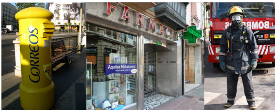
Fig. 41: Imágenes de un buzón de Correos, de una farmacia y de un bombero.

quioscos: se venden periódicos, revistas, coleccionables, etc.