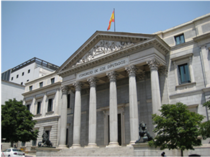
Fig. 6: Congreso de los Diputados.

El Congreso de los Diputados puede tener entre 300 y 400 diputados (en la actualidad está compuesto por 350 diputados). El Senado, también puede variar en el número de senadores que lo componen (en la actualidad está compuesto por 266 senadores). A cada