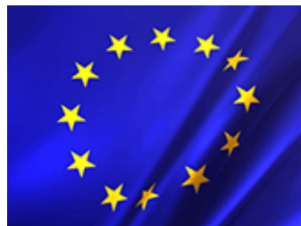
Fig. 5: Bandera de la Unión Europea.

España también forma parte de otras organizaciones internacionales, como la Organización de las Naciones Unidas (ONU); el Consejo de Europa (CE); la Organización del Tratado del Atlántico Norte (OTAN); la Organización para la Cooperación y el Desarrollo Económico (OCDE); la Organización para la Seguridad y la Cooperación en Europa (OSCE). Un lugar especial en las relaciones internacionales de España lo ocupa la Comunidad Iberoamericana de Naciones.