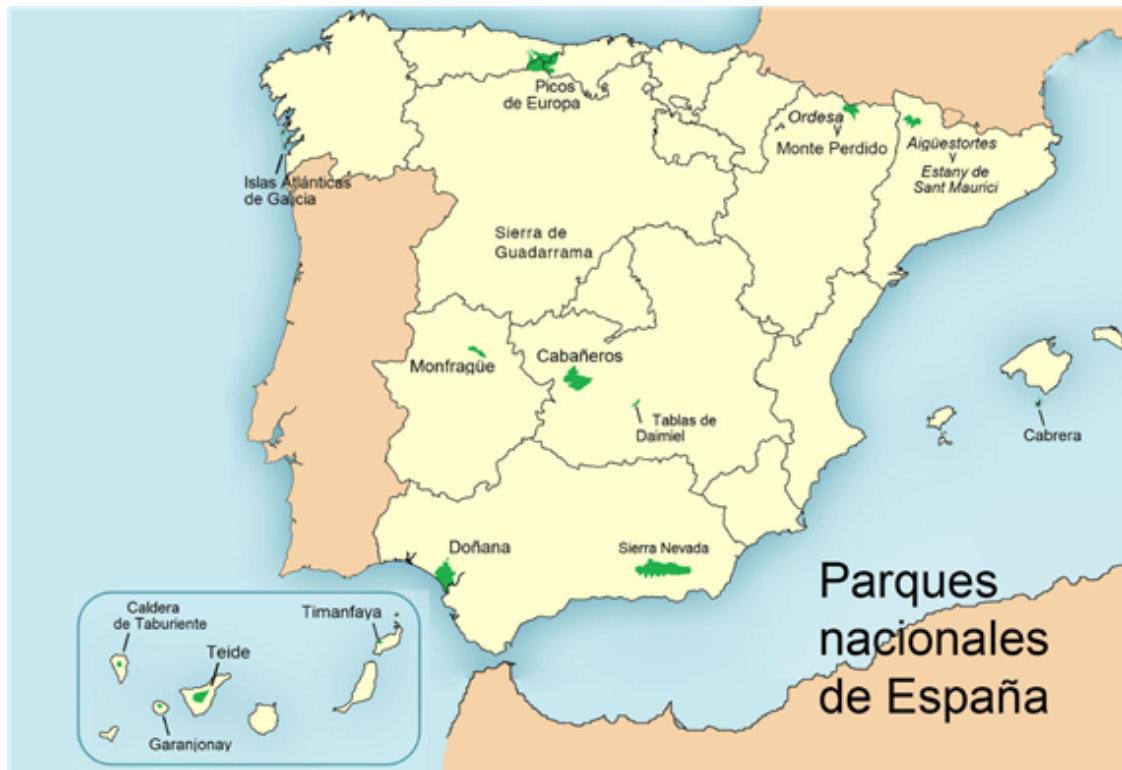
Fig. 15: Parques nacionales de España.

España fue uno de los primeros países de Europa en comenzar a proteger la naturaleza (la primera Ley de Parques Nacionales se aprobó en 1916). Tiene 15 parques nacionales; su gestión y protección se hace a través de la Red de Parques Nacionales.