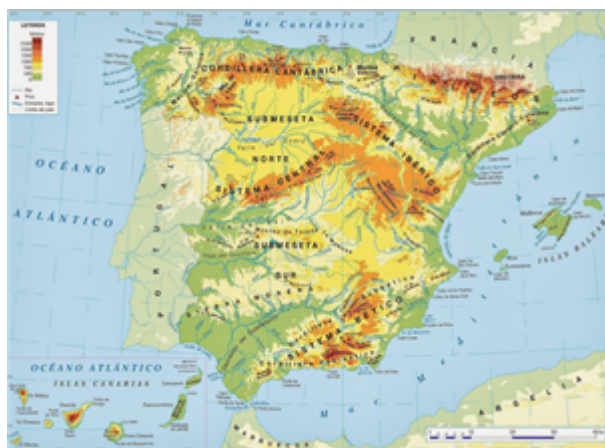
Fig. 14: Mapa físico de España.